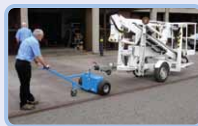
промышленность и производство