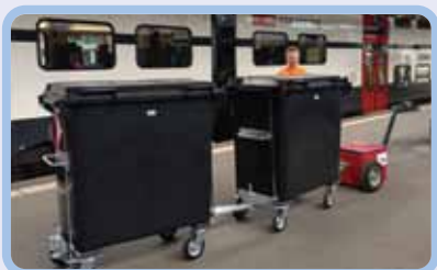
Клининговые компании и уборка