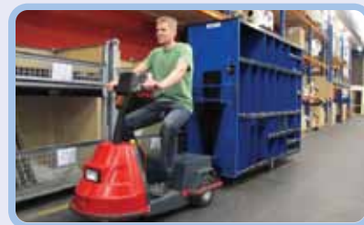
логистика и склад