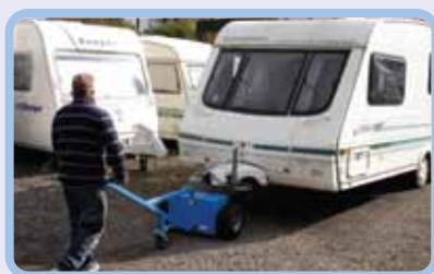
перемещение прицепов и трейлеров